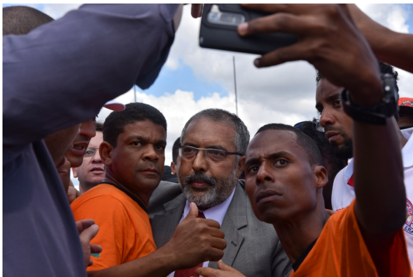
Manifestação em Brasília, 2017.

A trajetória de Paim mostra que o Parlamento pode ser espaço de luta, desde que não se separe das ruas. Em várias agendas - salário-mínimo, Previdência, reforma trabalhista, igualdade racial e inclusão - seu mandato funcionou como ponte entre movimentos sociais e processo legislativo.