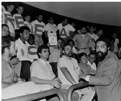
Deputado Paulo Paim, que propôs em 1989 um dos projetos de regulamentação do seguro-desemprego previsto na Constituição (CEDI/Câmara dos Deputados)