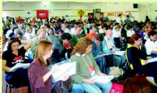
CUT-RS realizou sua Plenária em 16 e 17 de maio

Rumo à realização da Plenária Nacional Maria Ednalva (dias 5 a 8 de agosto, em São Paulo), a 12ª de nossa história, as CUTs realizam suas rodadas estaduais. Em junho, 19 estaduais farão a sua. Antes de cada Plenária Estatutária, as CUTs realizam as Plenárias das Mulheres. De cada plenária sairão textos-bases a ser apresentados na Plenária Nacional, que debaterá, entre outros temas, mudanças nos estatutos da CUT. Dia 8 de agosto, o Paço Municipal de São Bernardo, palco das primeiras mobilizações do Novo Sindicalismo, vai abrigar a grande Assembléia Nacional da CUT.