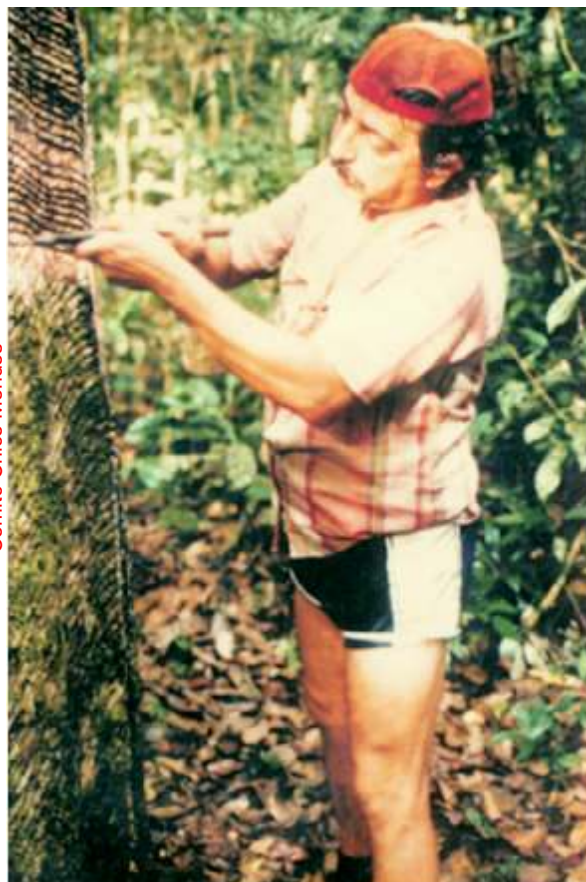
Comitê Chico Mendes