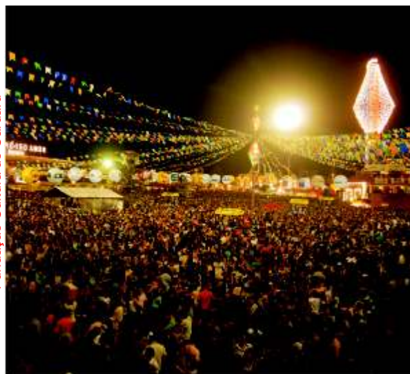
Fundação Cultura de Caruaru

A festa e seus costumes chegaram ao Brasil através de europeus e inicialmente eram restritos à elite nas grandes metrópoles. A quadrilha, por exemplo, era a