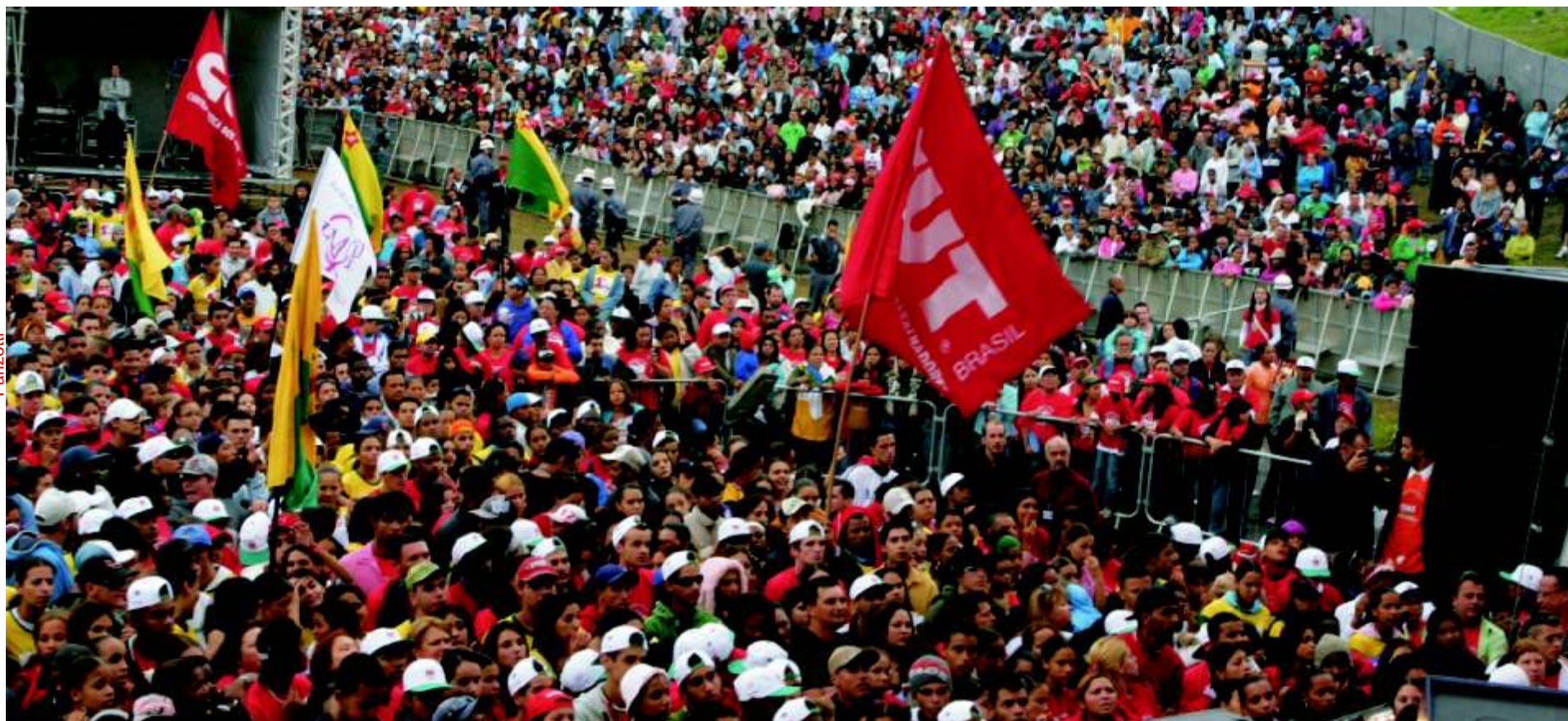
Mais de 300 mil trabalhadores e trabalhadoras foram ao 1º de Maio 2008 para festejar e debater

A disputa sindical nas bases vem se acirrando cada vez mais, desde antes do reconhecimento legal das centrais. Após a publicação, em abril, da Portaria 186 – que explicita e regulamenta maior liberdade sindical em relação a confederações e federações – a batalha tem tudo para se acentuar.