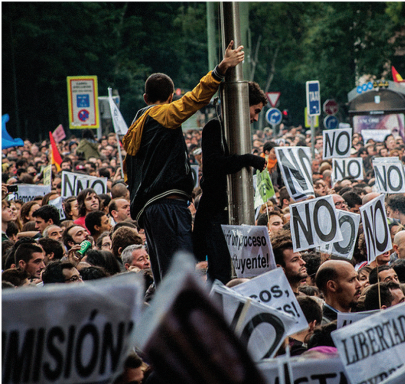
Neil Cummings/ Creative Commons